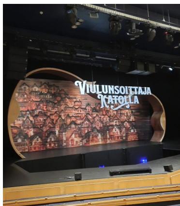
Alma ja Viulunsoittaja katolla