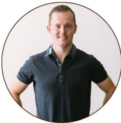
Tähtivieraana olympiavoittaja Sami Jauhojärvi.

Tule tutustumaan yhdistysten liikuntatoimintaan sekä alueen liikuntapalveluihin. Lisäksi voit kokeilla eri liikuntalajeja.