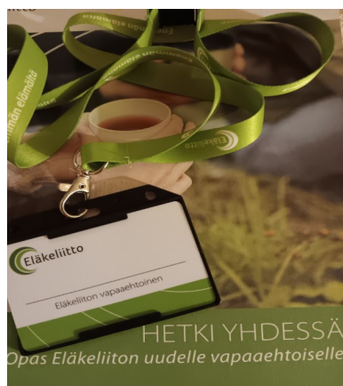
Kuva Eira Saarela